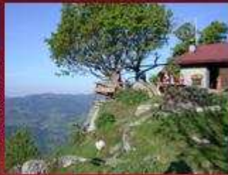
Refuge de Varan