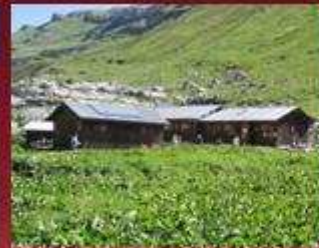
Refuge de Sales