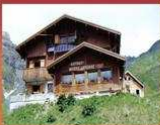
Refuge de Moëde Anteme