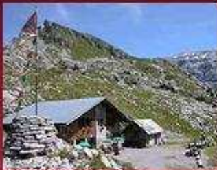
Refuge de Grenairon

Le site www.tourdesfiz.com permet de réserver facilement ses prestations dans les refuges.