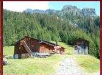
Refuge des Fonts