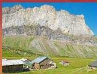
Refuge Alfred Wills