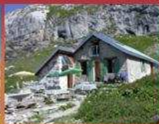
Refuge de Platé