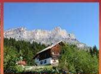
Refuge du Châtelet d'Ayères